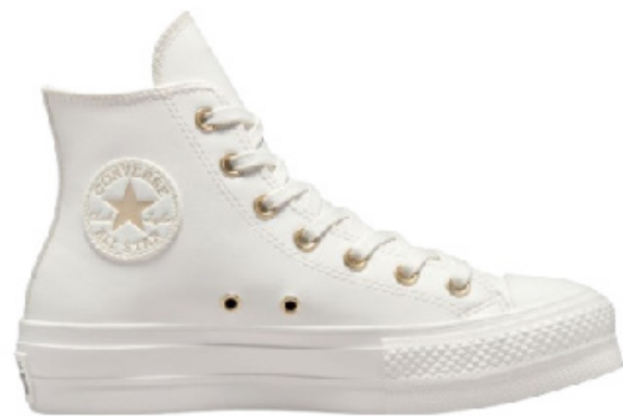
Plateforme sans liseré