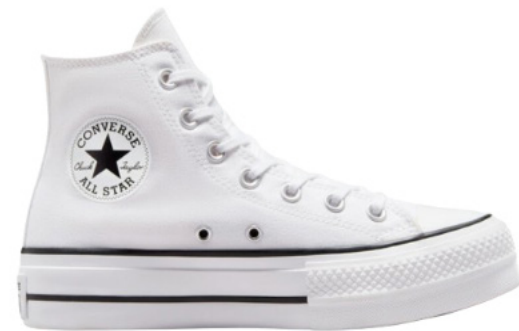
Plateforme liseré noir