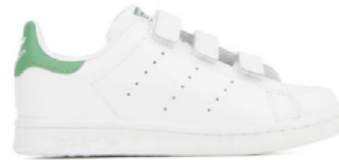
STAN SMITH (Couleur au choix)